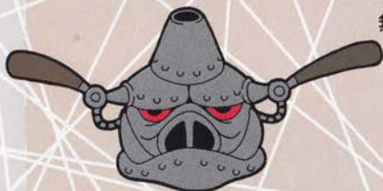
フライングブタヘッド